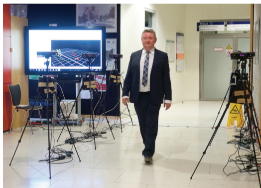
Lässt seinen Gang analysieren: Der damalige Bundesgesundheitsminister Hermann Gröhe.